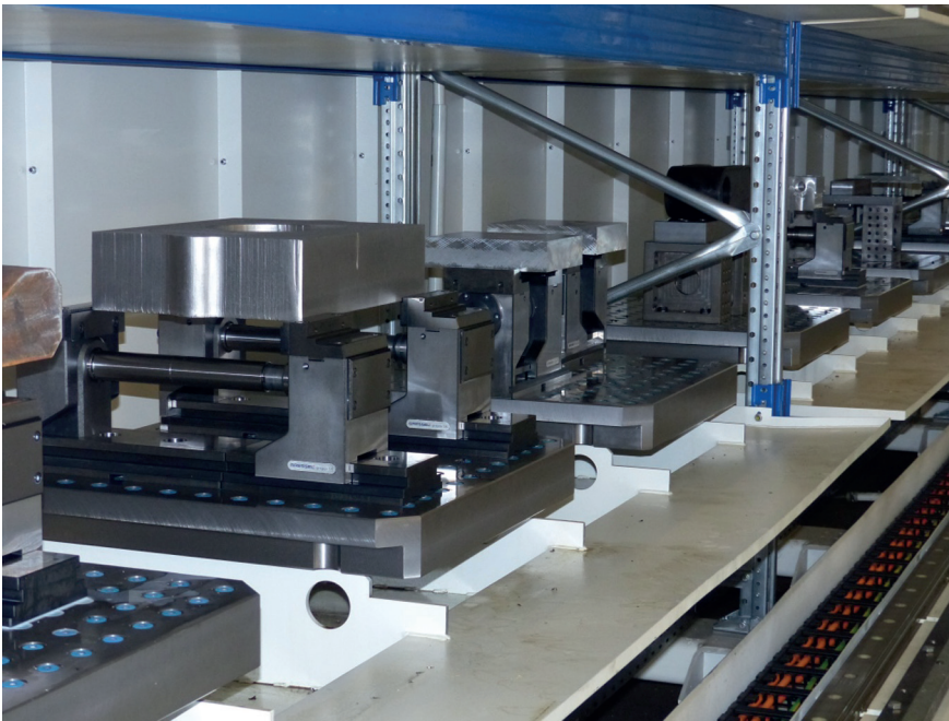
Bild 4: Im LoadMaster verfügt man über zwölf Plätze auf zwölf Rasterspannplatten. Genauigkeit und Stabilität sind einwandfrei

und in der automatisierten Fertigung durchgängig ein.