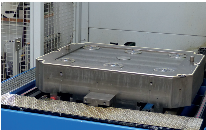
Bild 2: Das System ist einfach solide und wenig stör anfällig, die Dock Lock Autosafe 30 Spannzangen-Zylinder sind bis 15 t. Gewicht, für Einzugskräfte bis 20 kN und Haltekräfte bis 60 kN ausgelegt

Die Herausforderung in Heilbronn ist die Vielfalt der Bauteile. Werkzeuge bis 60 kg Gewicht und 1,0 m Länge sowie Verfahrwege bei den Werkstücken bis zu 2,0 m sind zu bewältigen. Nach einem intensiven Benchmark kam der Kontakt zu